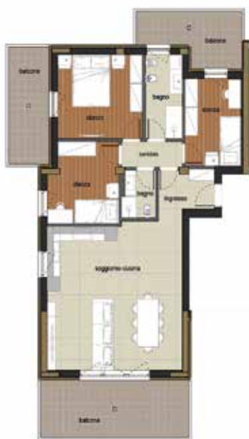
RIF. U.I. 03 1° PIANO