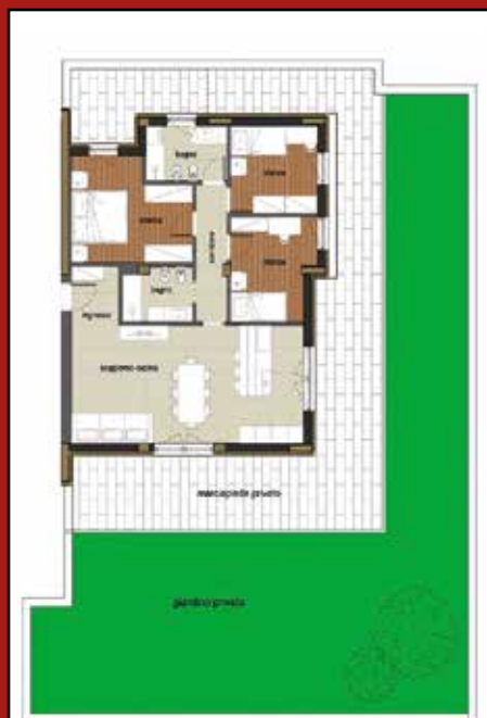
RIF. U.I. 02 PIANO TERRA