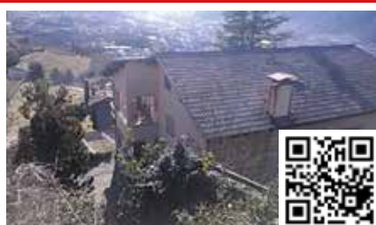
ZELL DI COGNOLA

vendesi miniappartamento composto da soggiorno con angolo cottura e balcone camera matrimoniale bagno posto auto condominiale. Euro 200.000,00. Il prezzo e' comprensivo dei lavori di ristrutturazione del palazzo, in cui verra' fatto il cappotto, con aumento della classe energetica a classe B. Se interessa viene lasciato l'arredamento incluso nel prezzo. E' possibile acquistare un garage doppio di grandi dimensioni ad euro 50.000