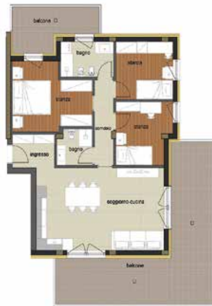
RIF. U.I. 08 2° PIANO